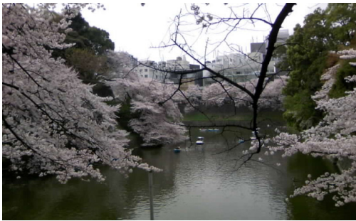
桜の名所 千鳥が淵

今年は、地震でびっくりしてしまったせいかも知れませんが、例年より桜の開花が遅れました。今年は、桜も怖がって、花を咲かせないのではと、ちょっと心配していましたが、結局4、5日遅れただけで、いつもの通り、きれいな花を咲かせてくれました。