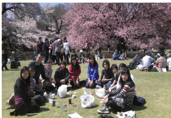
新宿御苑で花見を楽しむ学生たち

今年も、新学期の初めに、学生みんなと、お花見に行ってきました。天気もよかったし、桜も満開で、学生のみんなも、とても楽しそうに花を愛でていました。