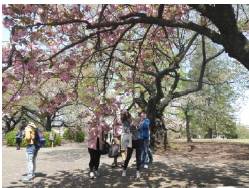
新宿御苑の桜(八重桜 今年も学生皆で御苑に行きました) (4月12日)