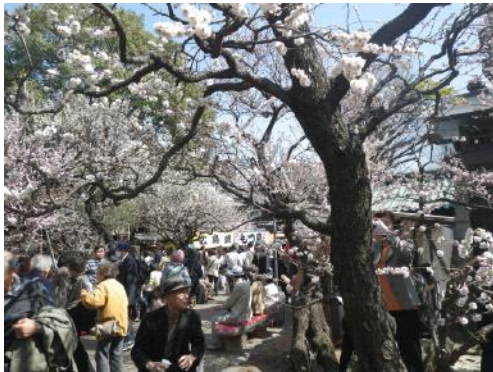
受験の神様「湯島天神」の梅 (3月9日)

日本では、年度の初めは4月です。2013年度が始まったわけです。皆さんの今年度が、満開の桜のようであればいいですね。