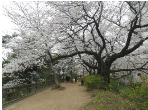
真田堀の桜(ソメイヨシノ) (3月24日)