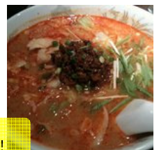
サンラートウショウメン これが酸辣刀削麵！