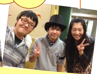
これは法政大学の新しい友達で す。