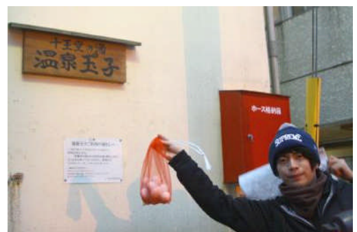
温泉でゆでた たまご