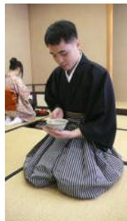
写真 A21 インゲン 記事 A21 サイギガク