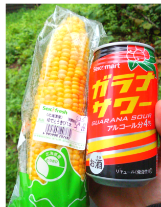
甘い！北海道のとうもろこ